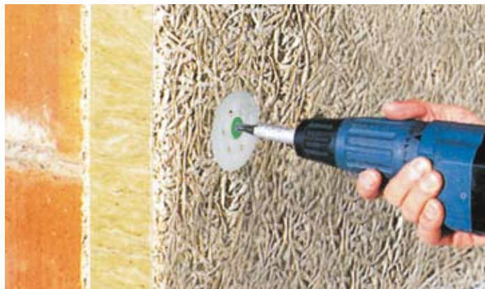
Tektalan E-21 für eine stoßfeste Fassade mit optimalem Brandschutz

Die Dämmplatte Tektalan E-21 , bestehend aus einem nicht brennbaren Heralan-Steinwollekern und einer beidseitig magnesitgebundenen Holzwolle-Deckschicht. Mit einem Dickputzsystem sorgt sie für eine stoßsichere Außenwand.