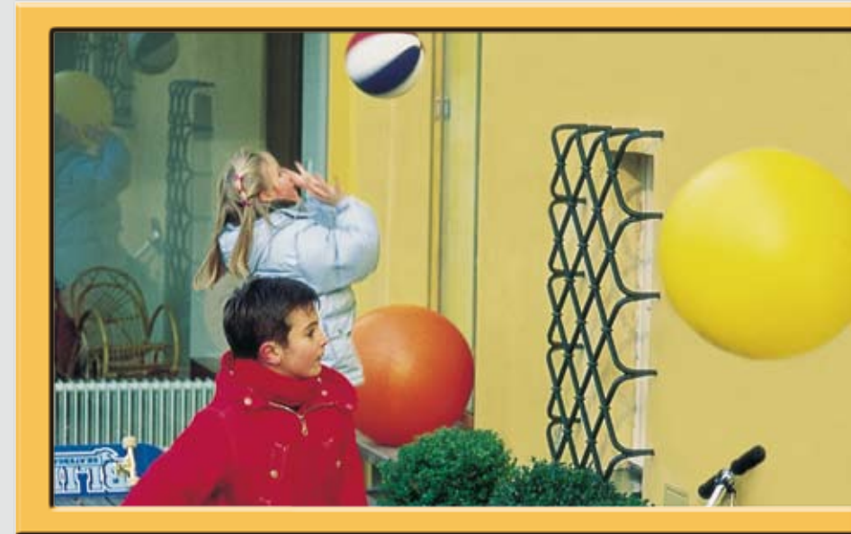
Stoßfeste Fassaden haben eine längerer Lebensdauer